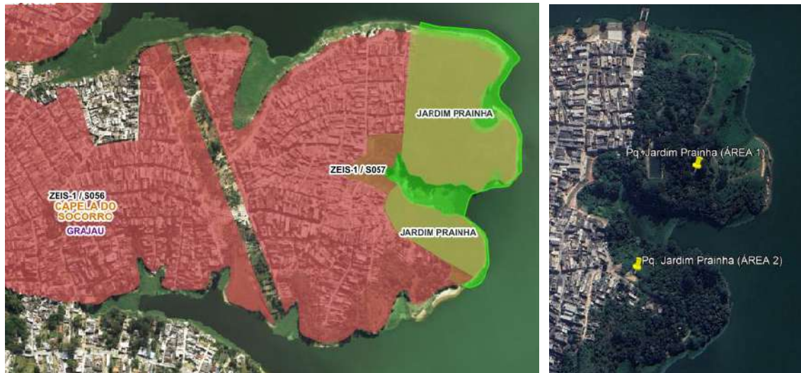
Figura 1: Localização do parque na cidade de São Paulo e inserção do parque na mancha urbana.

O Parque Jardim Prainha localiza-se na Subprefeitura do Capela do Socorro, Distrito do Grajaú, com acesso pela Rua Manfranz, 100, bairro Jardim Prainha. O Parque, que beira a Represa Billings possui duas áreas, objetos do Projeto Básico desenvolvido, que totalizam aproximadamente 92.092m 2 .